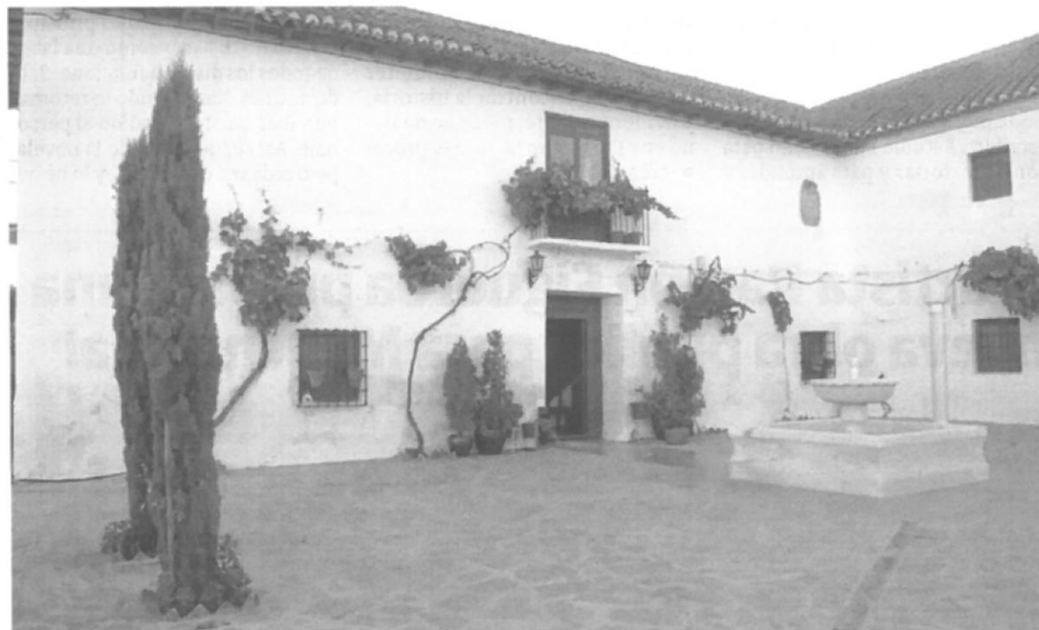
Patio de una almazara. :: IDEAL

dustria del olivar y analizar la aportación del oleoturismo. «Este primer congreso pretende ser una chispa inicial que desencadene un interés por la arquitectura de calidad en el sector». Así, detalló que hay tres objetivos prioritarios en esta primera edición: poner en valor el patrimonio ya edificado; tratar nuevas propuestas de construcción en el olivar; y fomentar el oleoturismo como una nueva vía de desarrollo para el olivar. Por su parte, Pablo Carazo, como director del Congreso, desglosó los contenidos de las distintas actividades programadas y ponencias, que se centrarán en varios aspectos, como ese recorrido por el patrimonio existente, pero también analizar propuestas realizadas en otros lugares (como en el mundo del vino de la Rioja o Ribera del Duero), donde se ha apostado por esa arquitectura de calidad adaptada a cubrir las necesidades de un sector productivo, pero también destina-